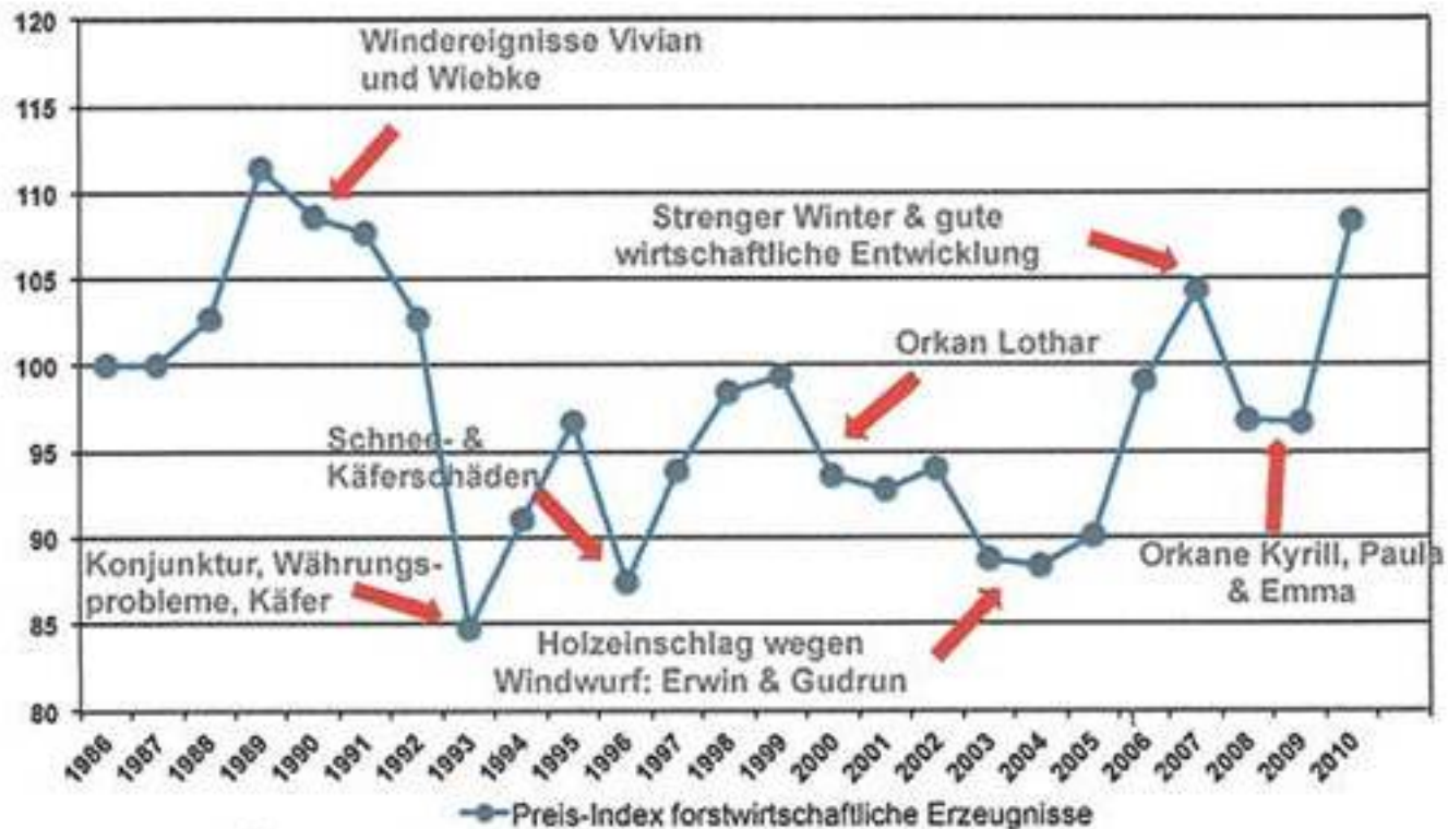
Abb. 1: Nominell 10 % höher als vor 25 Jahren liegt der Nadelrundholzpreis in Österreich – Schadereignisse bedingten starke Schwankungen.